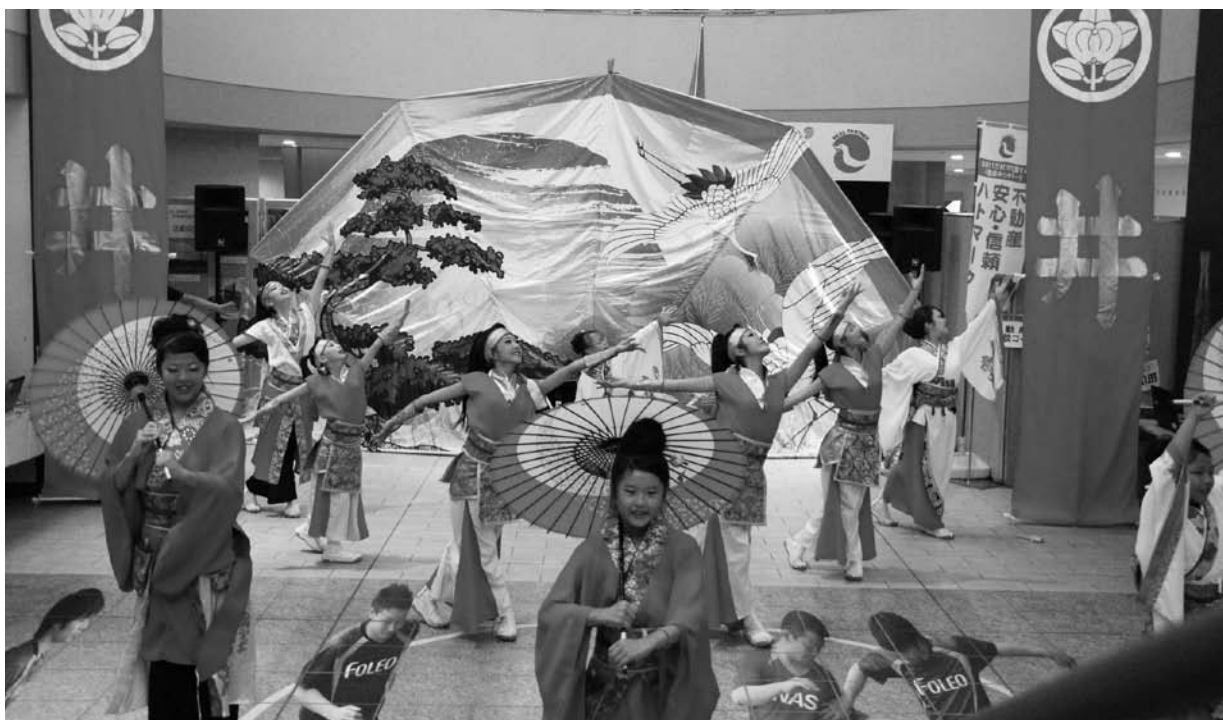
よさこいソーラン

平成24年9月23日(日)不動産の日にあわせて、平成24年度不動産フェアをフォレオ大津一里山にて開催いたしました。