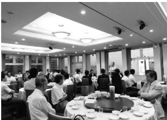
平成24年度会員交流会を県内3カ所にて実施

しました。第1地域会場は、9月4日(火)あたか飯店大津店にて61社72名、第2地域会場は、あたか飯店草津店にて70社88名、第3地域会場は、マリアージュ彦根にて61社70名の参加があった。各会場とも昨年度の約2倍の参加者があり、大いに盛り上がり活気のある会員交流会となりました。これからも会員間の横のつながりを大切に、会員交流会・新年賀詞交歓会等を企画して参りますので、ぜひご参加くださいますよう、よろしくお願いいたします。