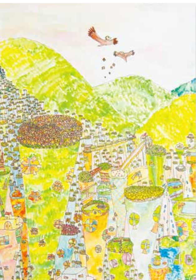
タイトル「屋上にある町」 大津市立晴嵐小学校5年生作品