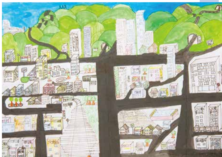
タイトル「都会の彦根」 彦根市城東小学校5年生作品