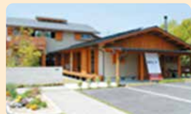
会社兼ギャラリー店舗

長浜市内保町7 TEL 0749-74-0161 / FAX 0749-74-0514 免許番号 滋賀県知事(4)第2553号 URL http://www.uchiboseizai.com/ info@uchiboseizai.com 業態/製材・建築・不動産業