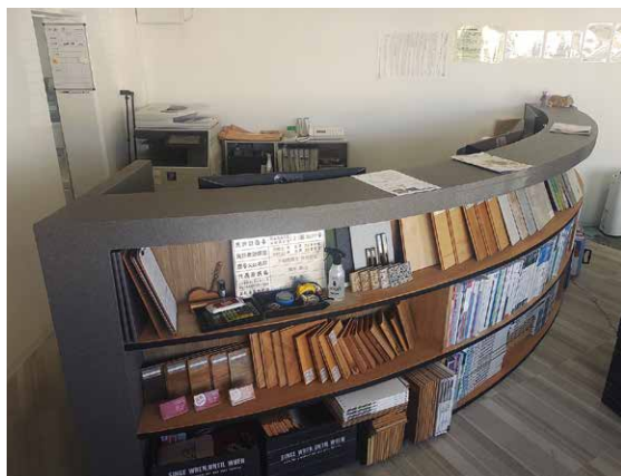
塚本社長手作りのカウンター

取材にうかがった12月は、店舗の屋根や壁、エントランスなどに本格的なクリスマスイルミネーションが設置されていました。毎年、社員総出で飾り付けするイルミネーションを楽しみに見に来られる人も多く、同社のピーアールにも一役買っているそうです。