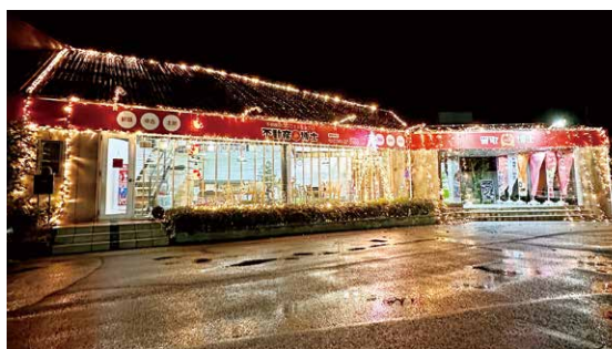
社員総出で飾り付けたクリスマスイルミネーション