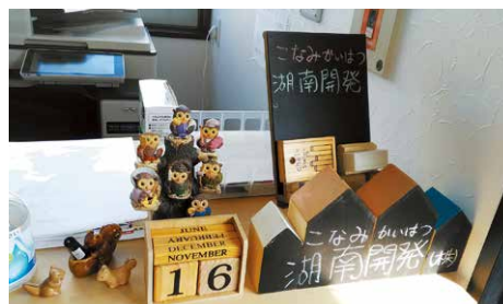
女性らしい可愛い小物が飾られた店舗