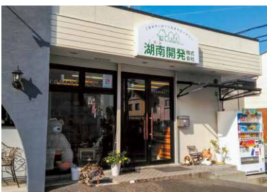
栗東市下鉤にある社屋