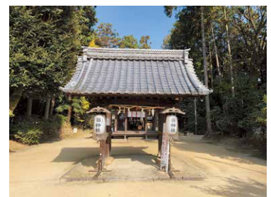
全国でもめずらしいきのこを祀る菌神社