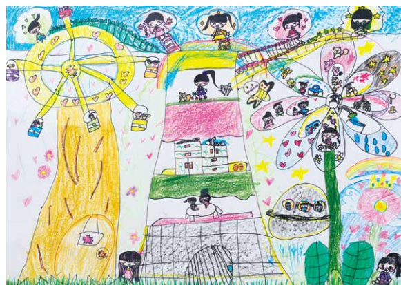
滋賀県教育委員会教育長賞