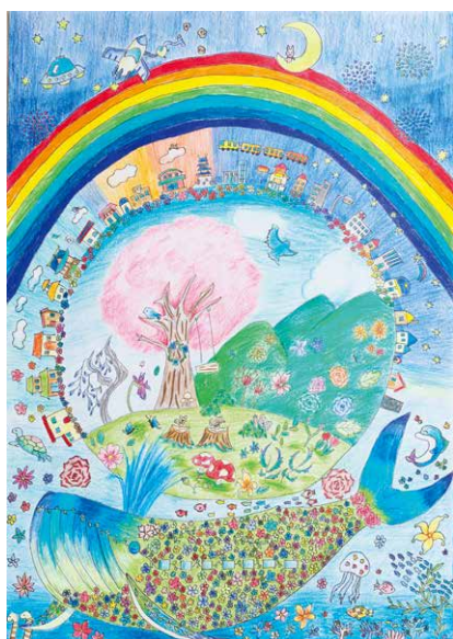
滋賀県宅建協会会長賞