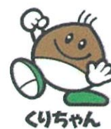
栗東市 マスコットキャラクター